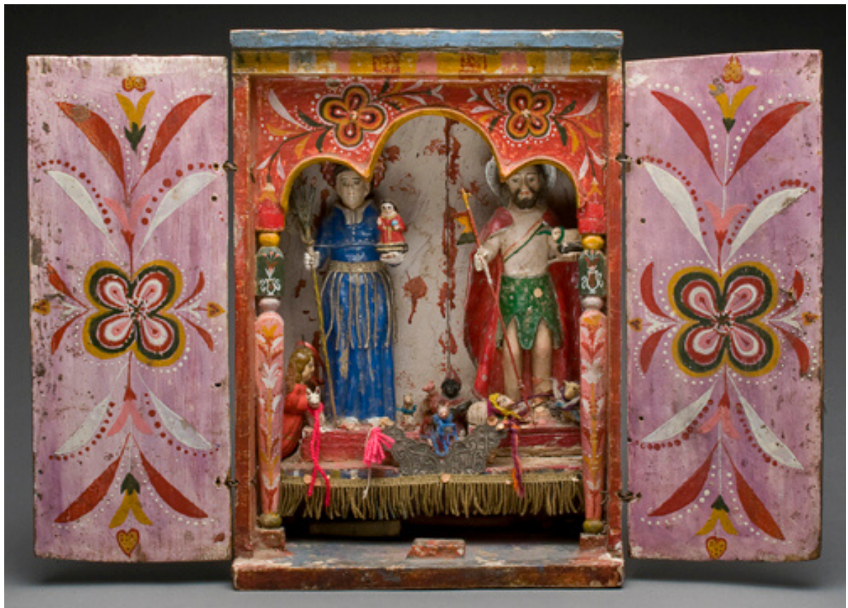
Portable Altar with San Antonio and San Juan Bautista. Potosí, Bolivia, ca. 1940. Private Collection.