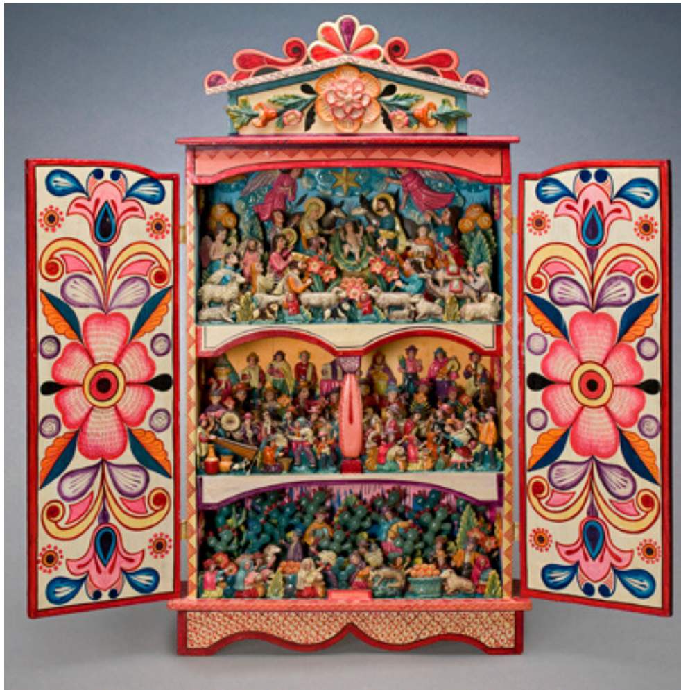
Marino Palomino, Box with Scenes . Huancavelica, Peru, ca. 1985. Gift of Lloyd E. Cotsen, MOIFA.